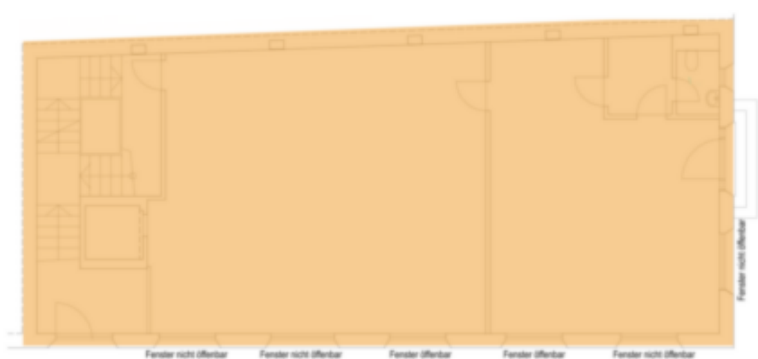
Erdgeschoss - Piano Terra