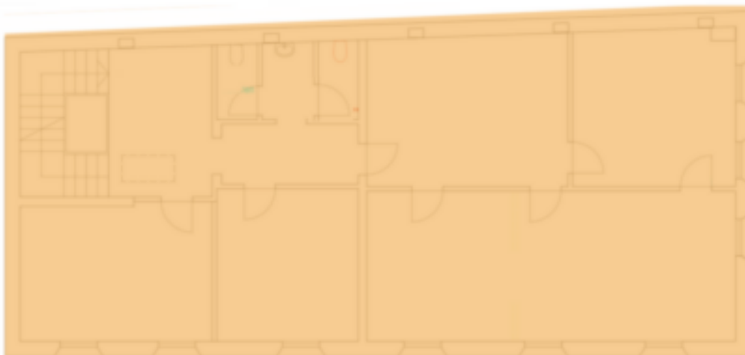
2. Obergeschoss - Secondo Piano