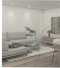
2 Zimmerwohnung im 1. Obergeschoss.