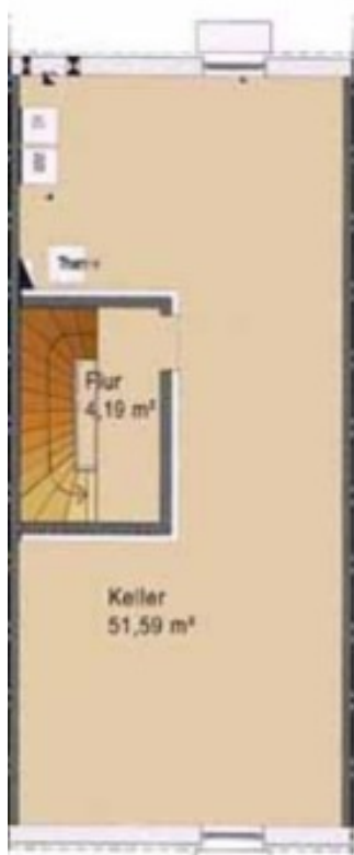
Kellergeschoss piano scantinato

Planimetria generica di una villa a schiera