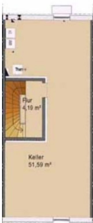
Kellergeschoss piano scantinato

Planimetria generica di una villa a schiera