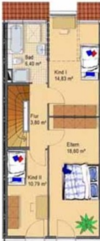
Schlafbereich zona notte