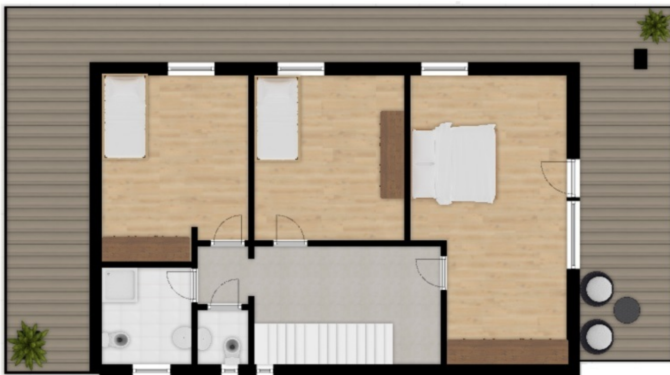
1. Stock - 1° piano