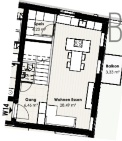
Wohnung 14 - 1. Obergeschoss