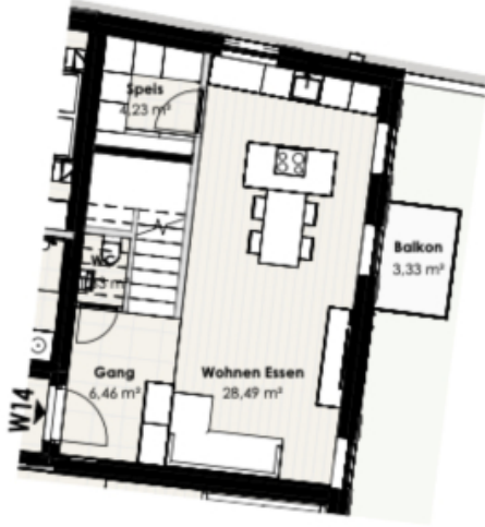
Wohnung 14 - 1. Obergeschoss