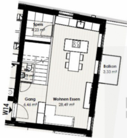
Wohnung 14 - 1. Obergeschoss