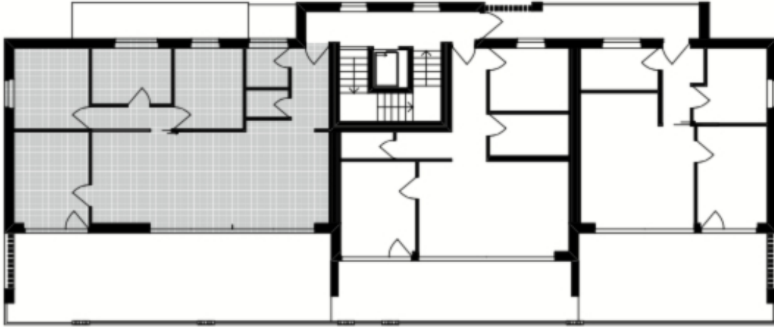
2. Obergeschoss Übersichtsplan