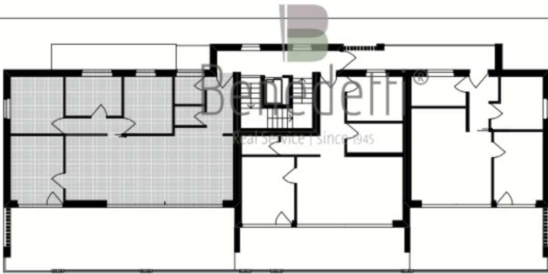
2. Obergeschoss Übersichtsplan