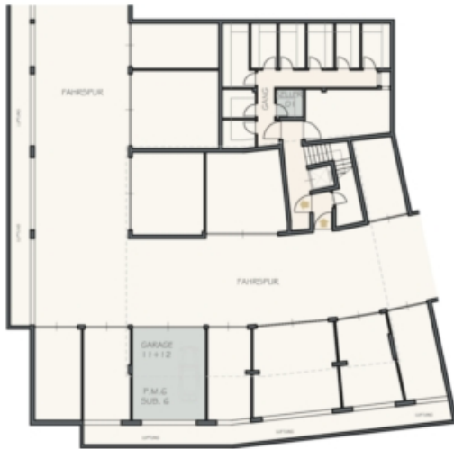
UNTERGESCHOSS PIANO INTERRATO