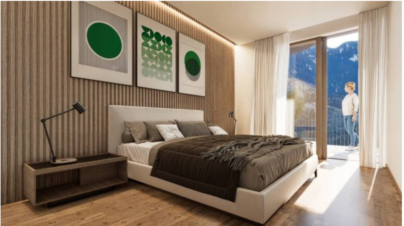
2. Stock / 2. Piano