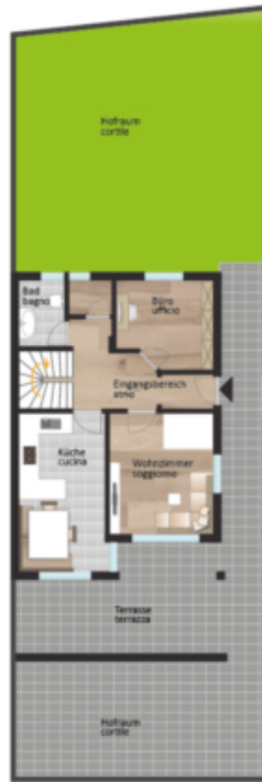
Erdgeschoss piano terra