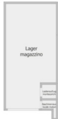
Kellergeschoss piano interrato