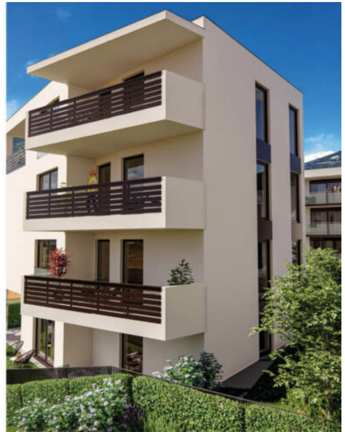
Haus B - Ansicht Süd-Ost Casa B - prospetto sud-est