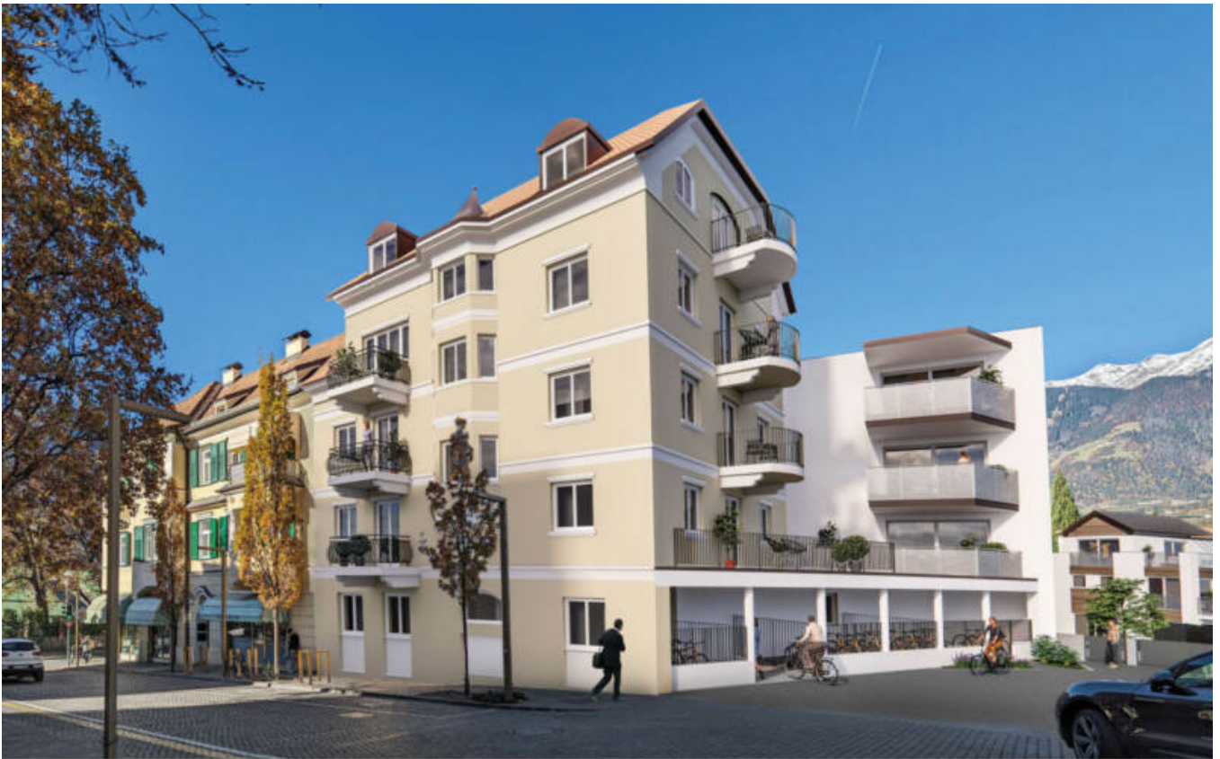
Wohnanlage Maria-Cristina complesso residenziale