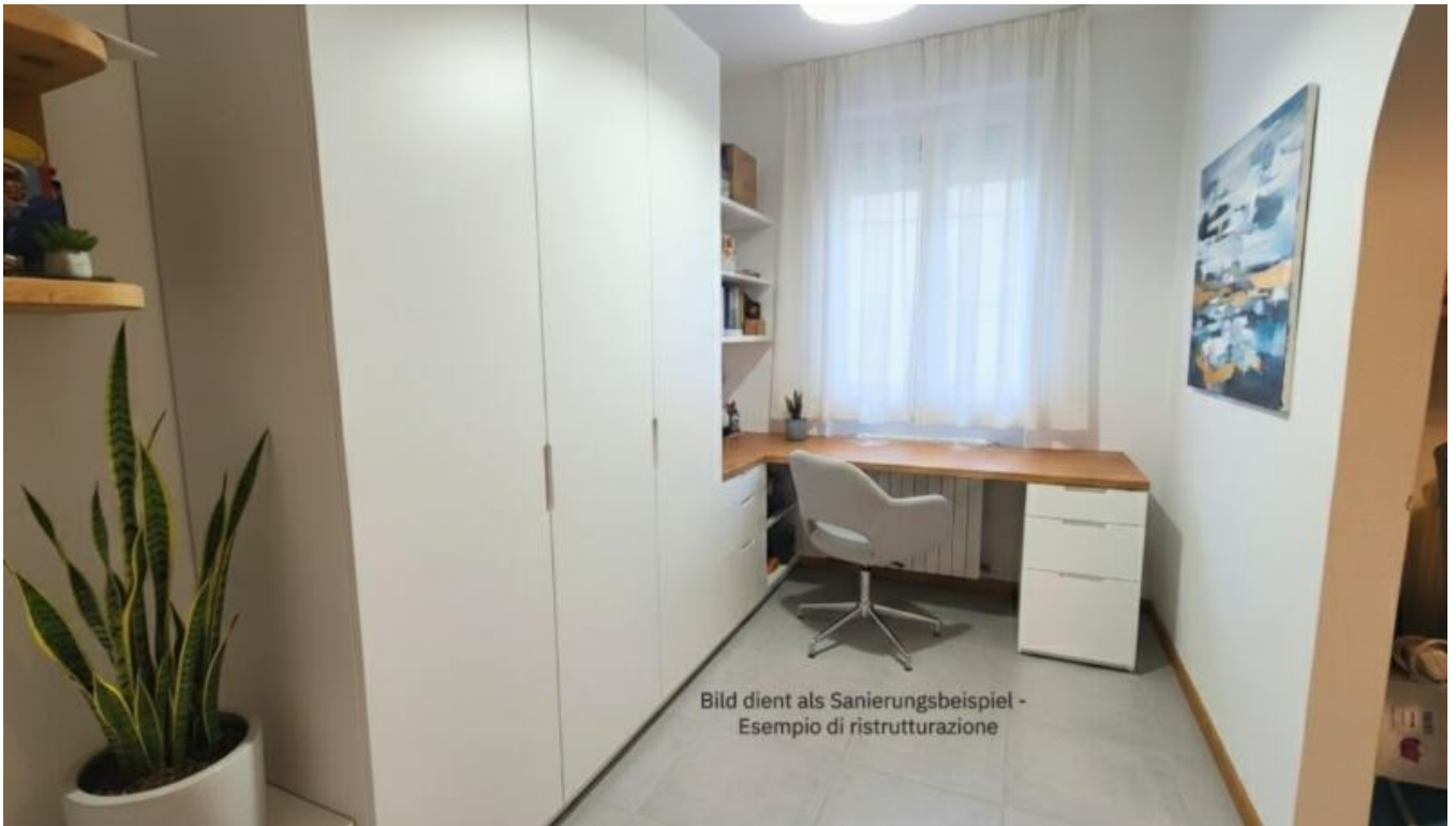
Bild dient als Sanierungsbeispiel - Esempio di ristrutturazione