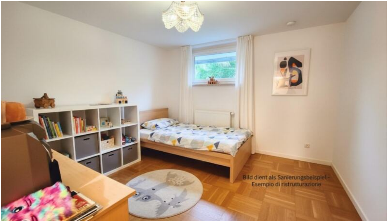
Bild dient als Sanierungsbeispiel - Esempio di ristrutturazione