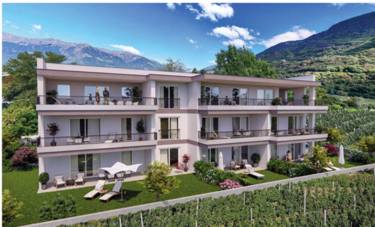
Wohnanlage Sina - Sinich-Sinigo/Meran-o complesso residenziale