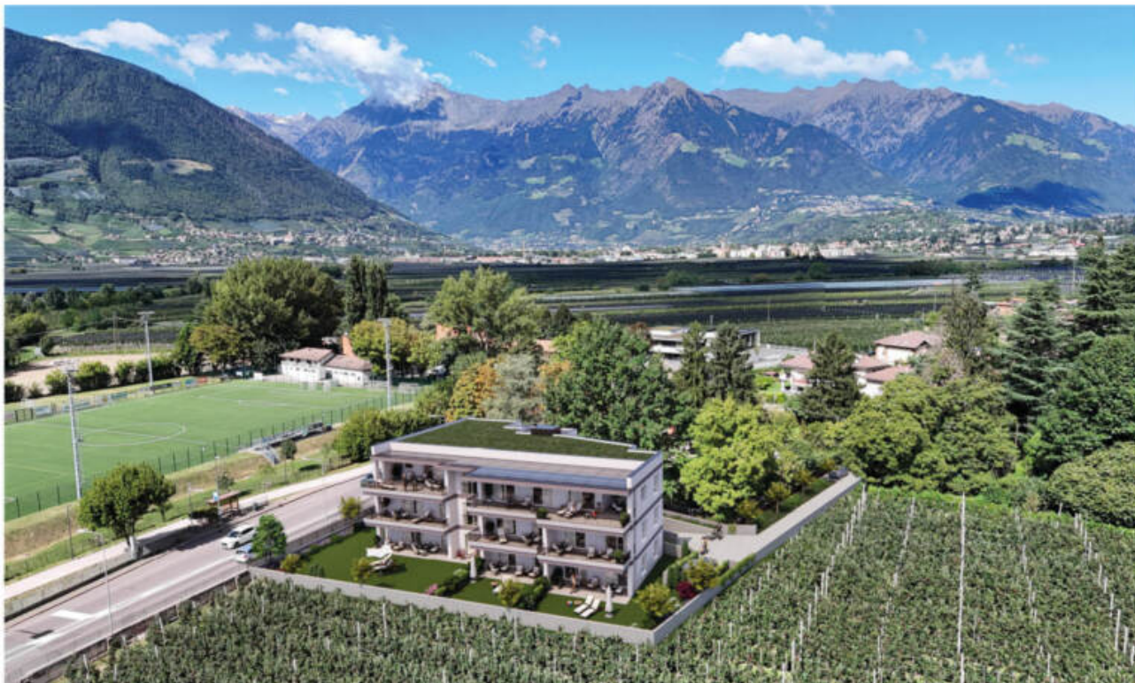
Wohnanlage Sina - Sinich-Sinigo/Meran-o complesso residenziale