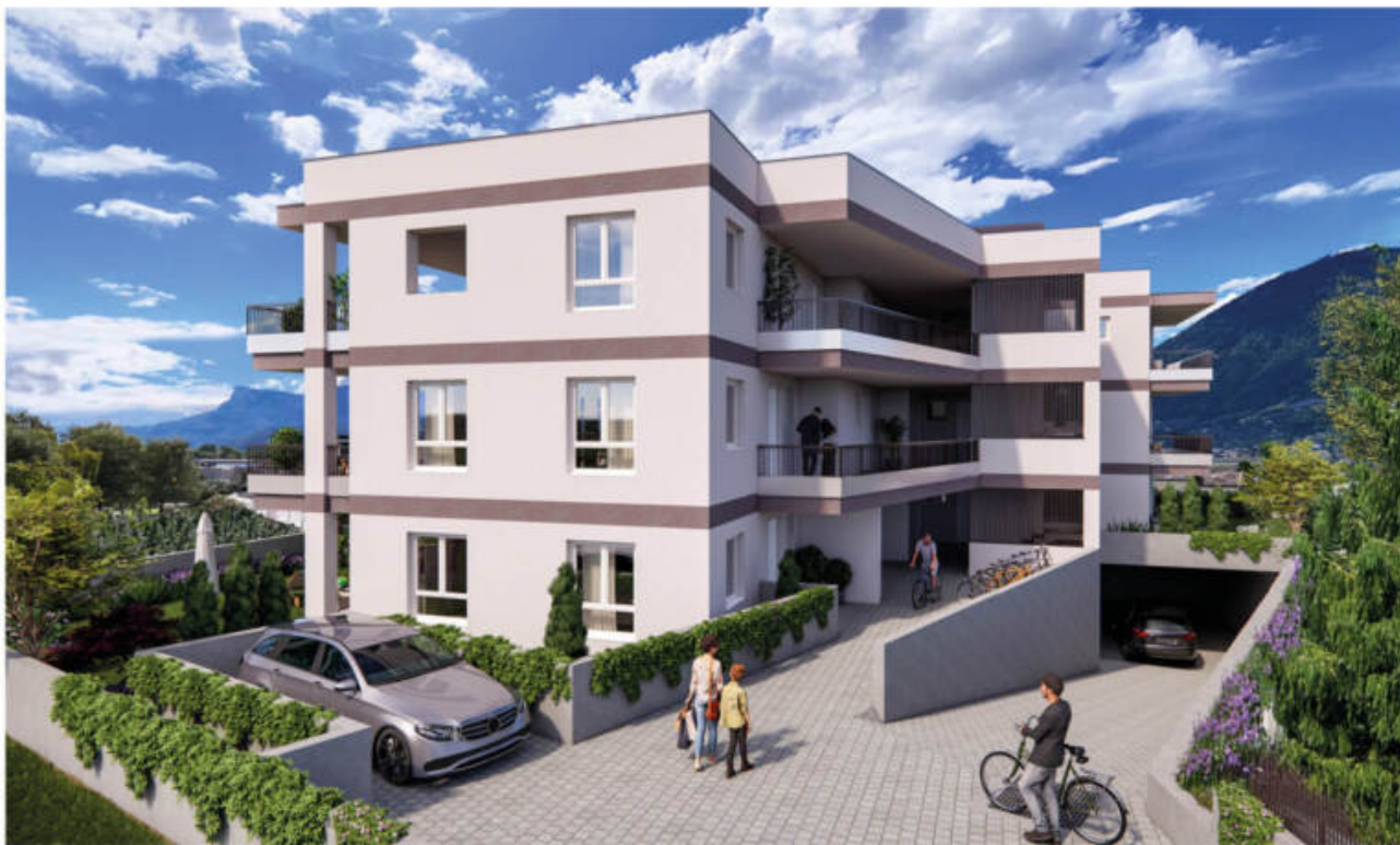
Wohnanlage Sina - Sinich-Sinigo/Meran-o complesso residenziale