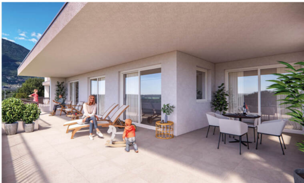
Wohnanlage Sina - Sinich-Sinigo/Meran-o complesso residenziale