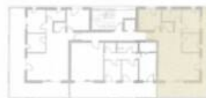
2. Obergeschoss - Secondo piano