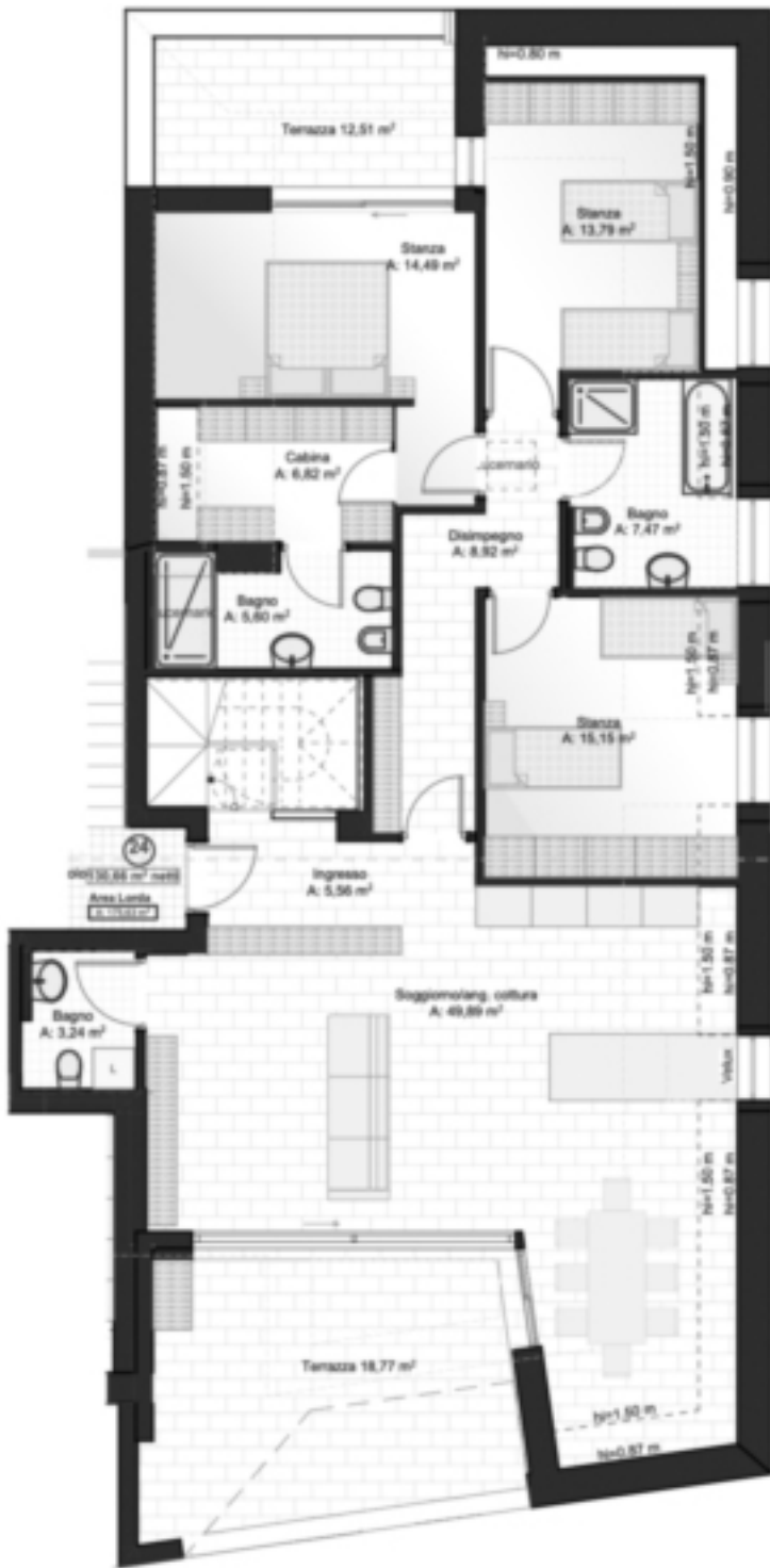
4. APPARTAMENTO n. 24 1:100