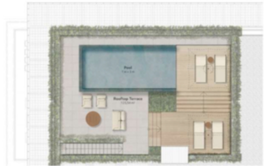
L1 - Mandorlo 129,99 m 2 zona giorno 43,14 m 2 terrazza 123,54 m 2 terrazza sul tetto