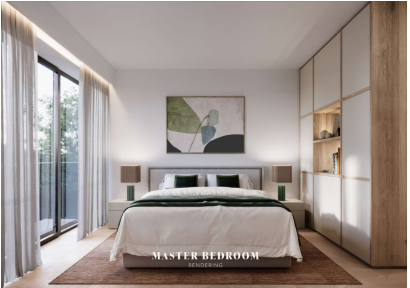
MASTER BEDROOM RENDERING