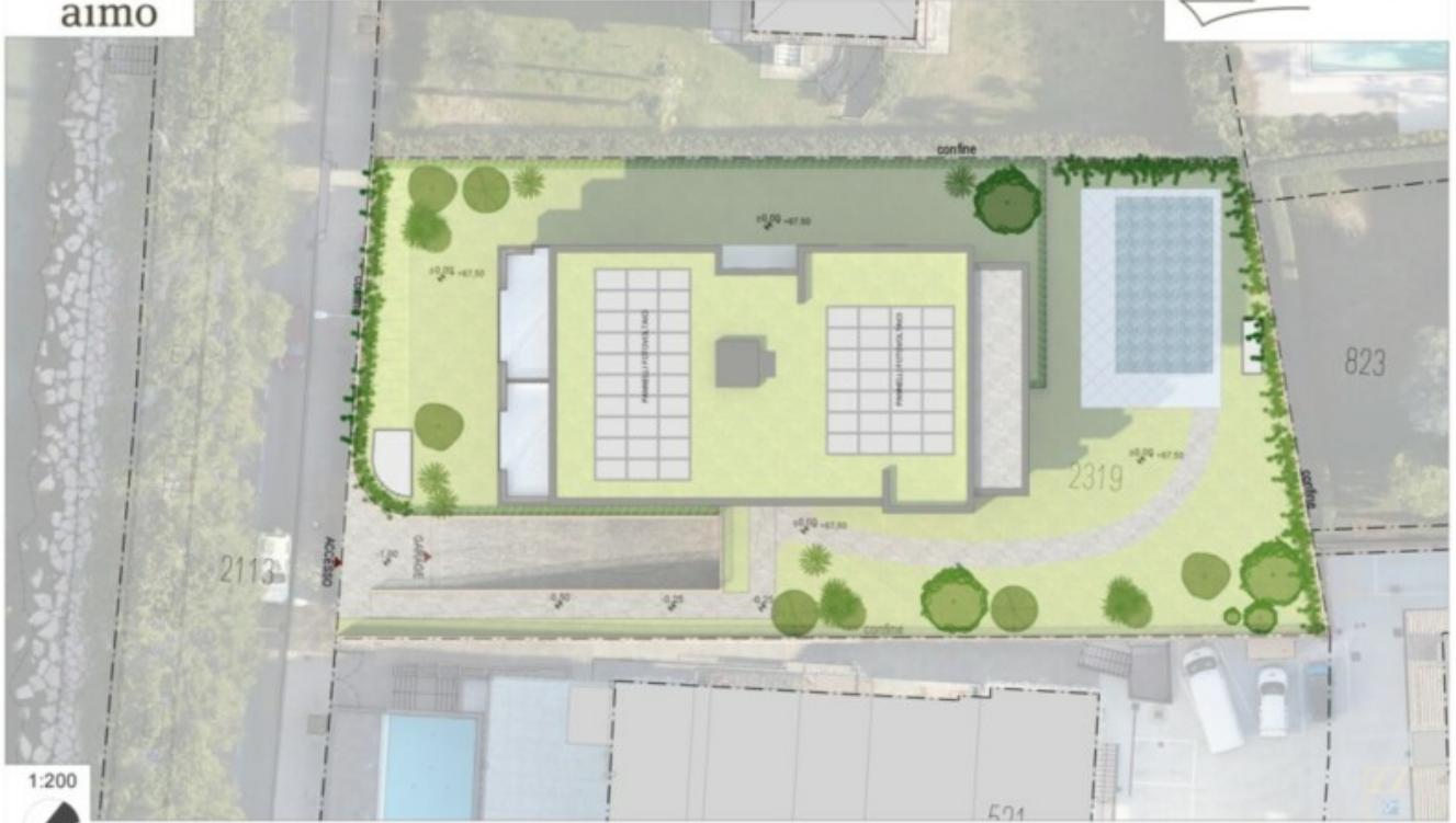
LAGEPLAN - PLANIMETRIA