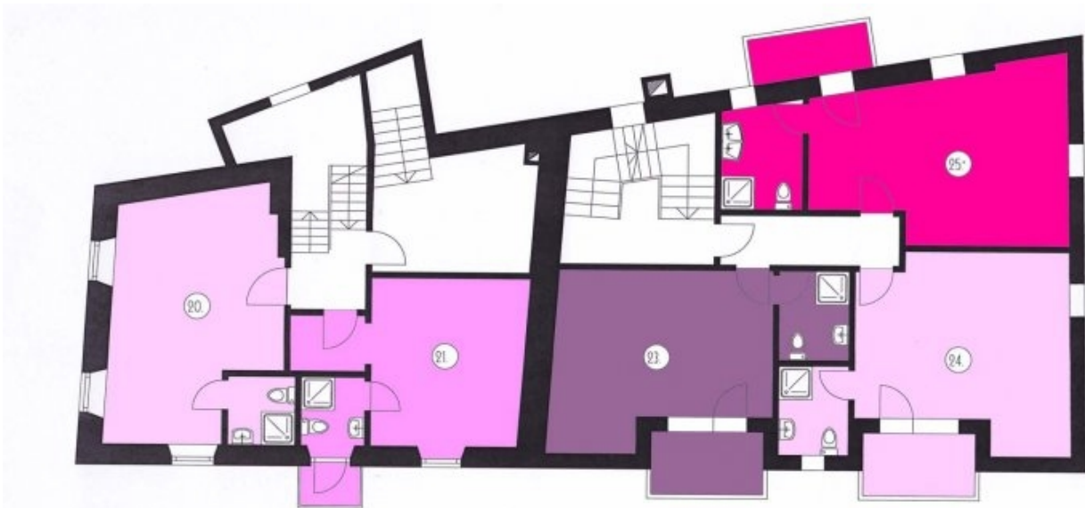
2. Obergeschoss - 2. piano