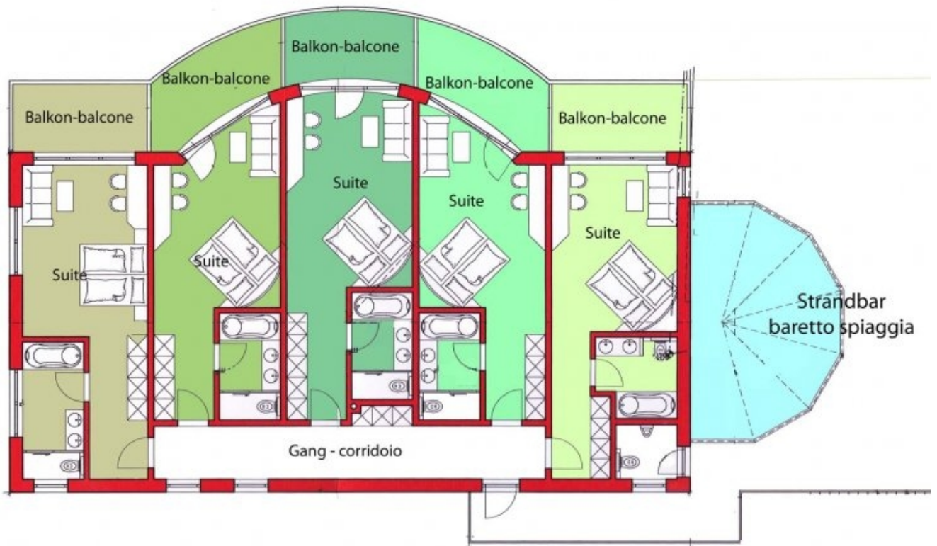
Neubau - costruzione nuova