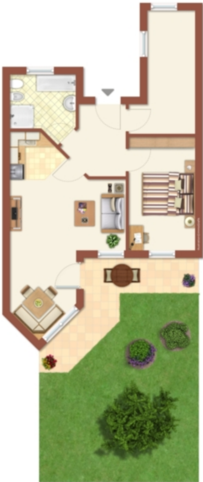
Espresplan, nicht maßstäblich