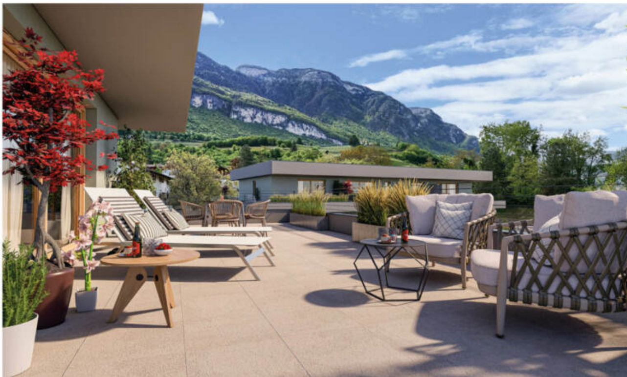
Wohnanlage Viride - Neumarkt/Egna complesso residenziale