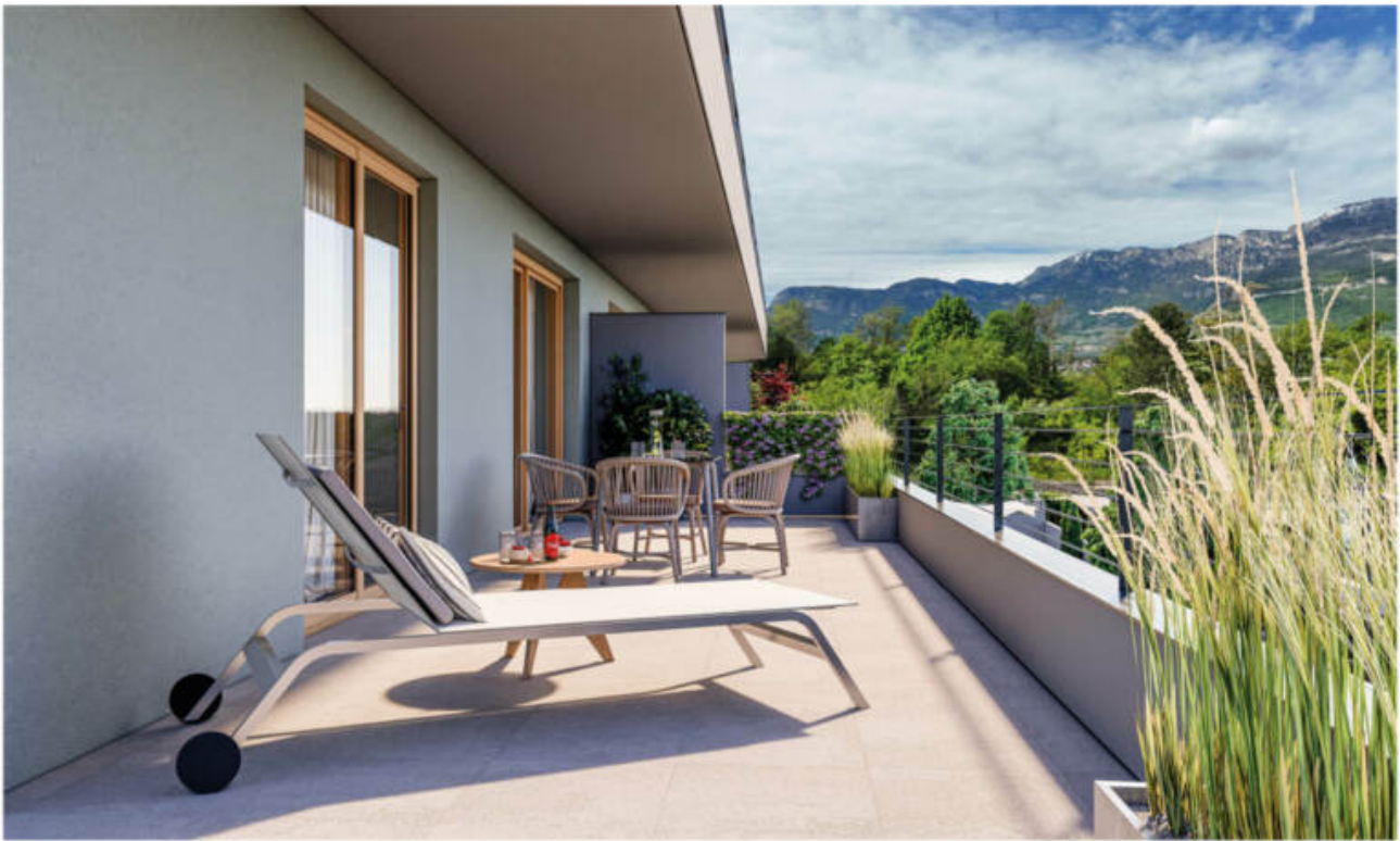
Wohnanlage Viride - Neumarkt/Egna complesso residenziale