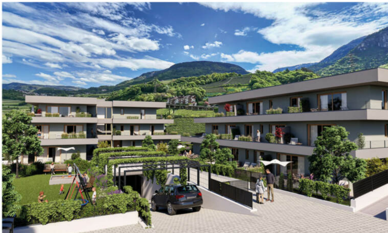
Wohnanlage Viride - Neumarkt/Egna complesso residenziale