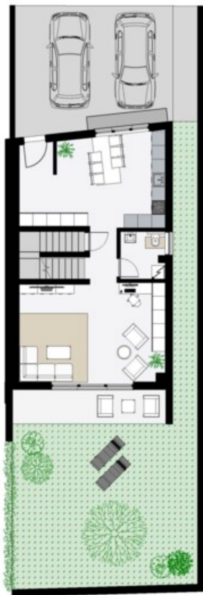
Erdgeschoss - Piano Terra