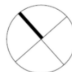
Untergeschoss - Piano Interrato