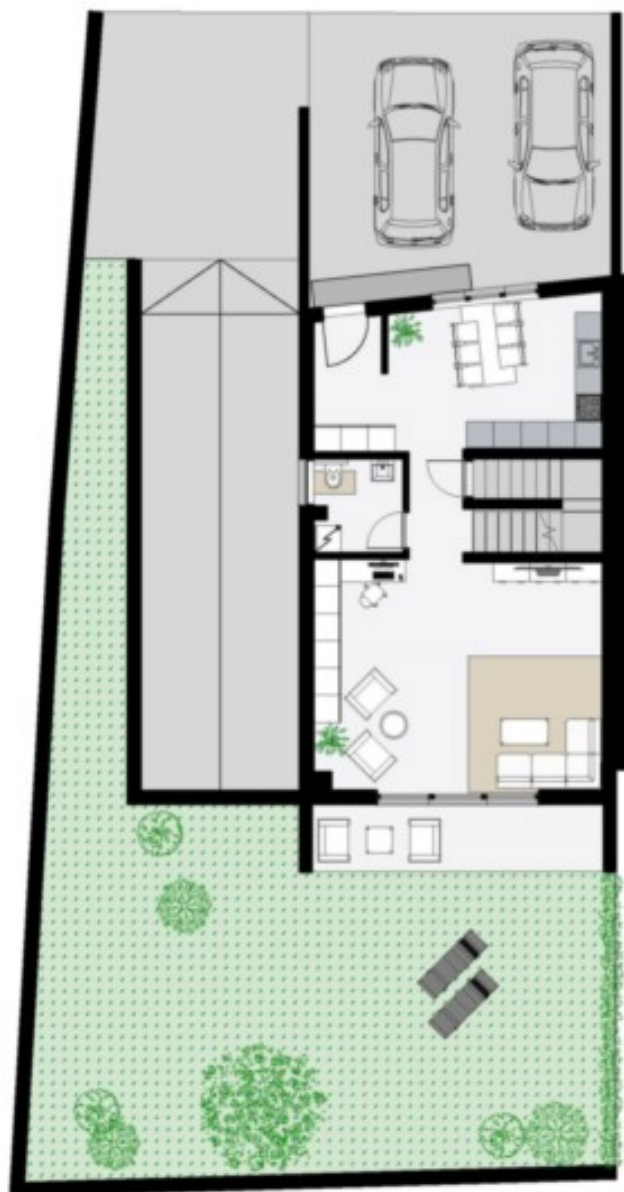
Erdgeschoss - Piano Terra