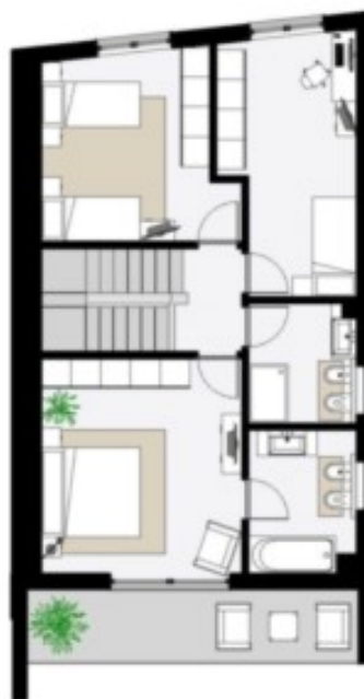
Este Obergeschoss - Piano Primo