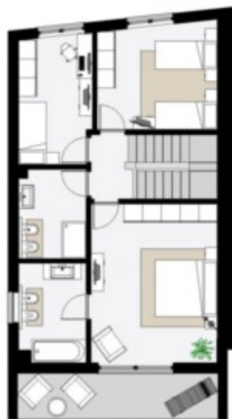
Este Obergeschoss - Piano Primo