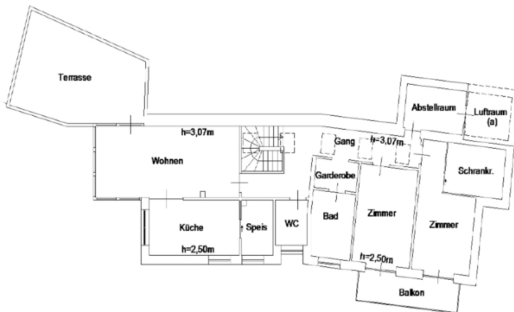
1. Stock Piano Primo