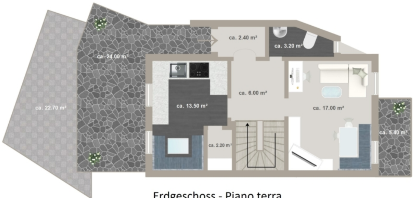
Erdgeschoss - Piano terra