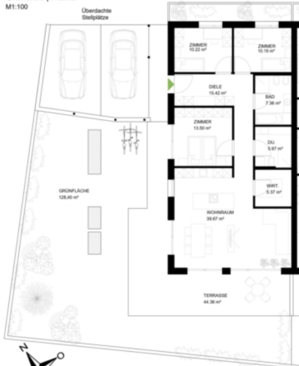
Grundriss | Pianta M1:100