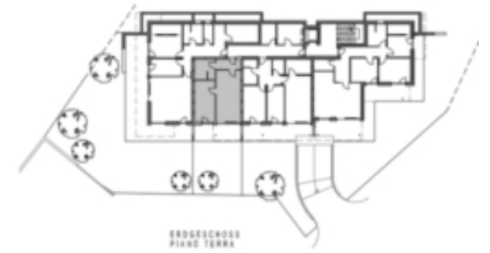
PROGRESSO SIANO TERRA

RESIDENCE NEURAUTH AHORNACH GP 788/2 KG AHORNACH RESIDENCE NEURAUTH ACERETO PF 788/2 CC ACERETO WOHNUNG 3 - APPARTAMENTO 3