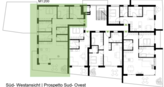
Süd- Westansicht | Prospetto Sud- Ovest