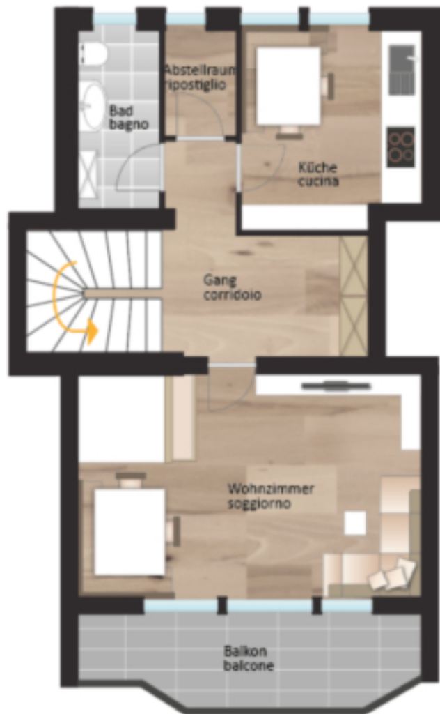
1. Obergeschoss primo piano