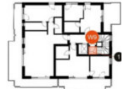
2. Obergeschoss / Piano Second