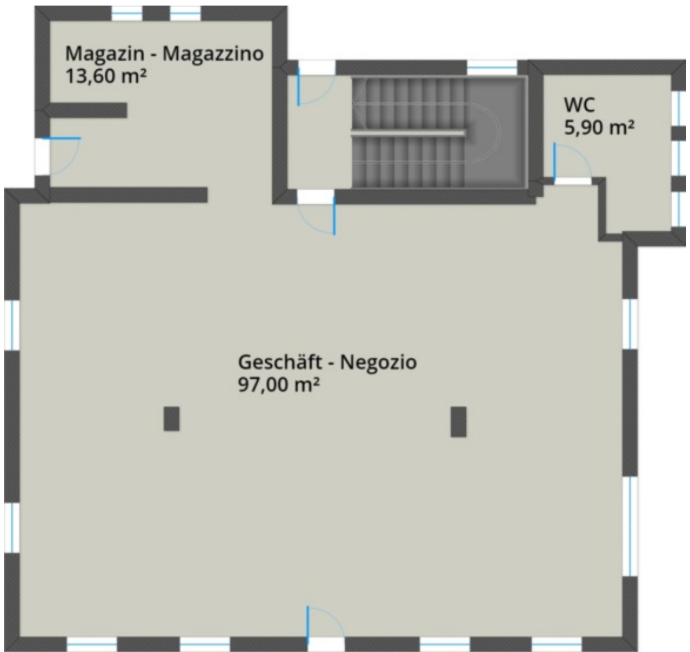
Erdgeschoss - Piano terra