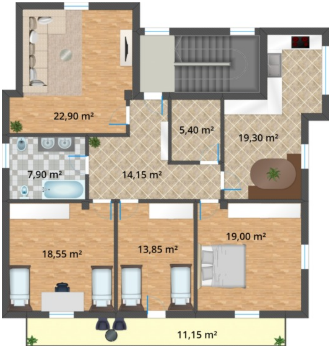
1. Stock - Primo piano