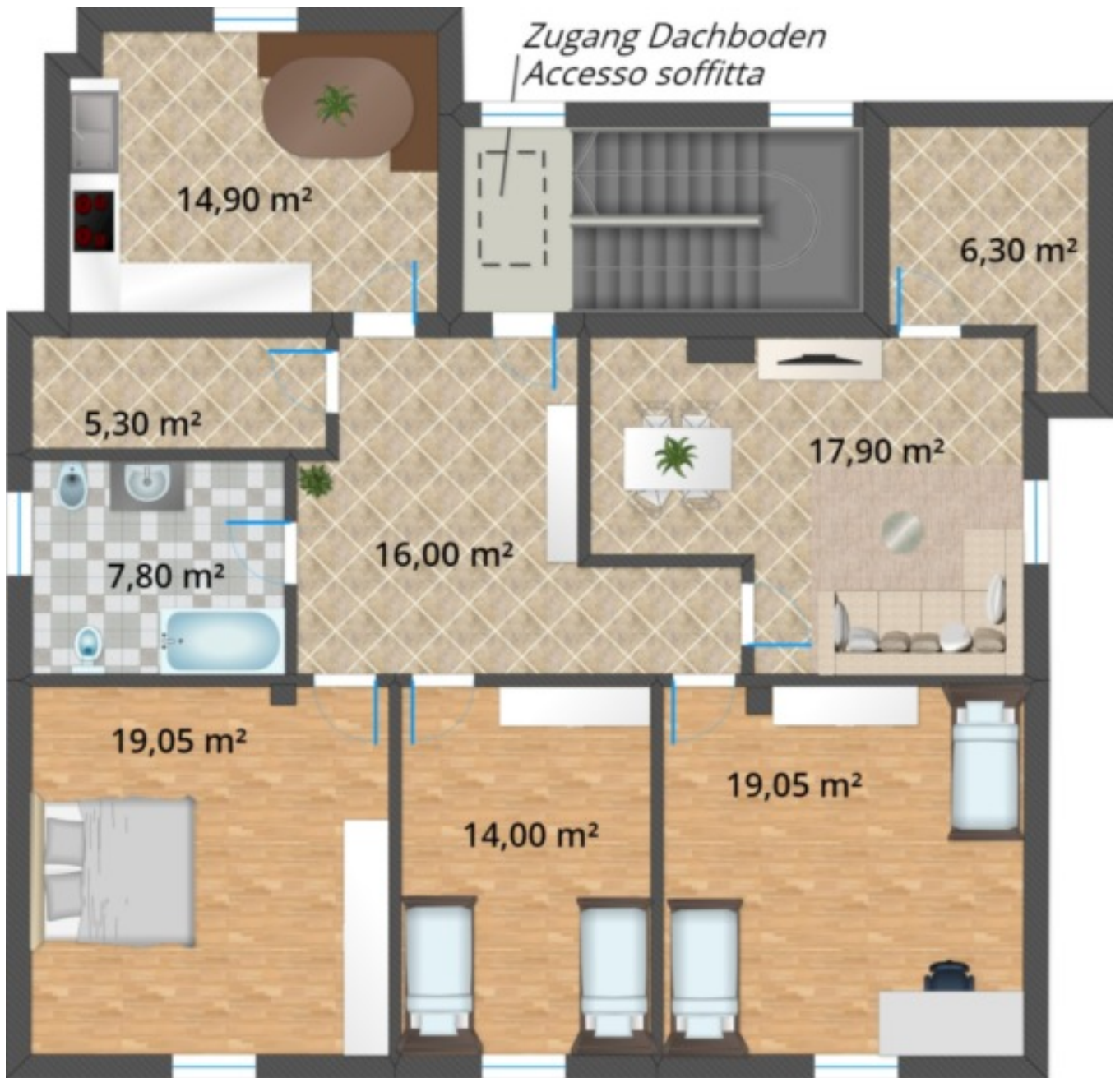
2. Stock - Secondo piano