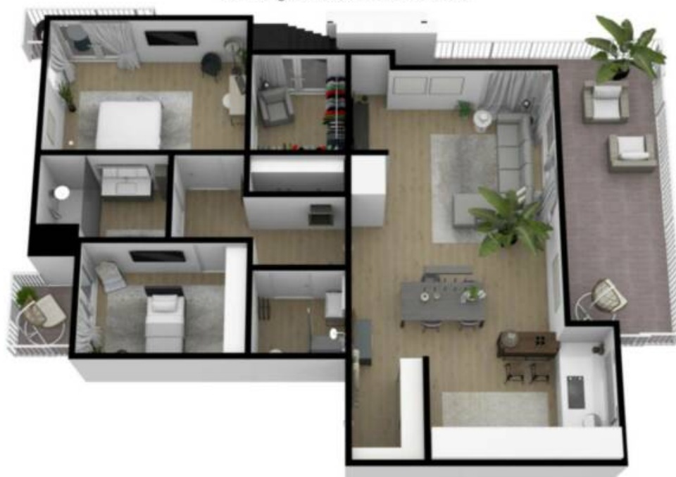
2. Obergeschoss / Piano secondo