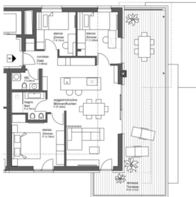
WOHNUNG 8 - APPARTAMENTO 8

FLÄCHE - SUPERFICIE: NETTO 83,97 m 2 BRUTTO 104,33 m 2 TERRASSE 47,21 m 2 TERRAZZA