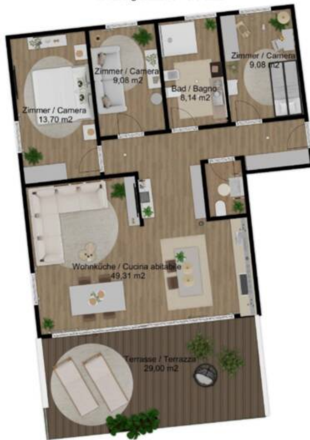
1. Obergeschoss - 1. Piano