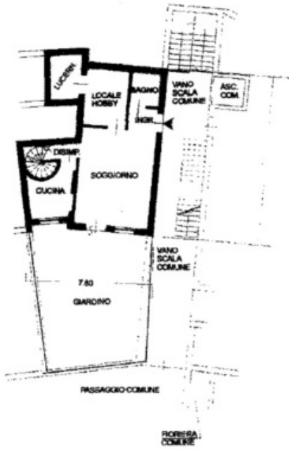
PIANO TERRA H = 2,60