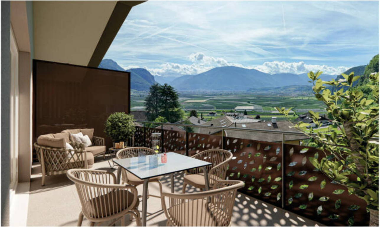
Wohnanlage Andrian - Am Berg complesso residenziale