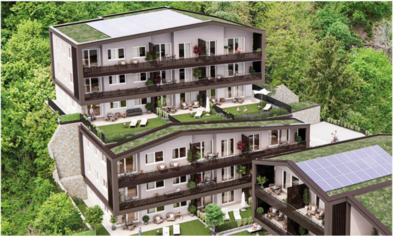
Wohnanlage Andrian - Am Berg complesso residenziale