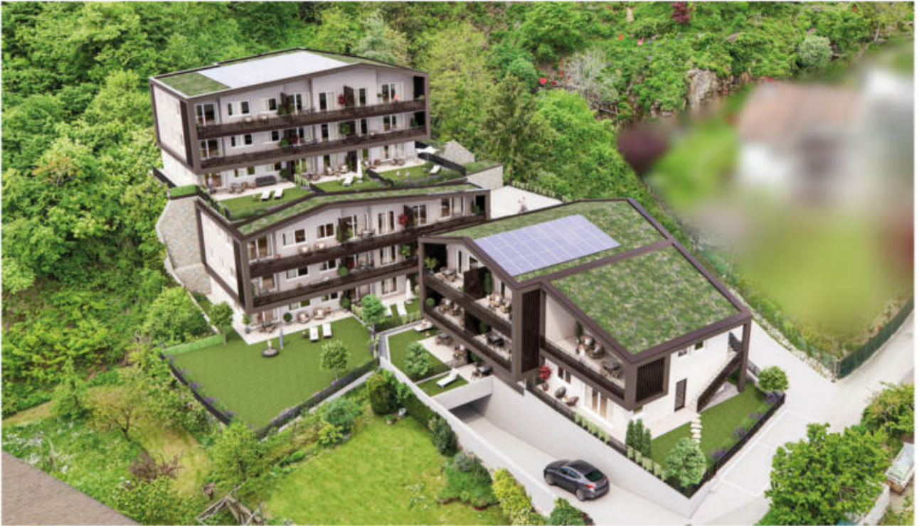
Wohnanlage Andrian - Am Berg complesso residenziale