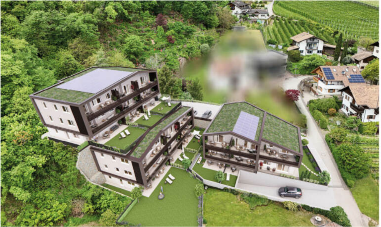
Wohnanlage Andrian - Am Berg complesso residenziale