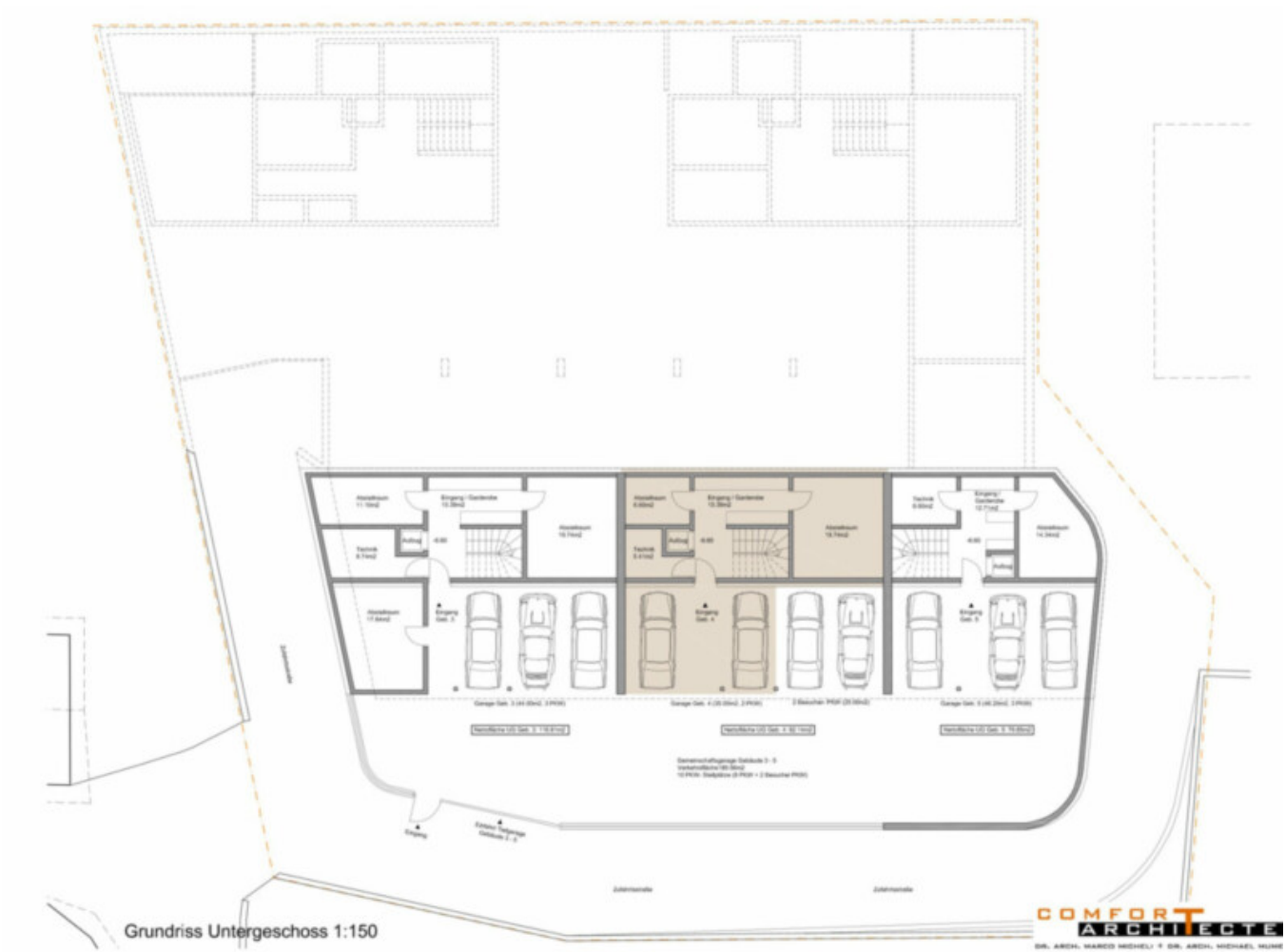
Grundriss Untergeschoss 1:150