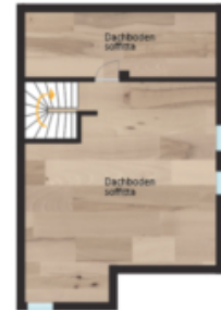
2. Obergeschoss 2° piano