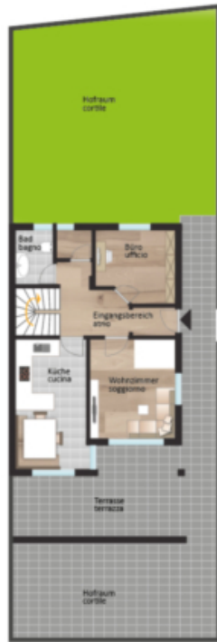
Erdgeschoss piano terra