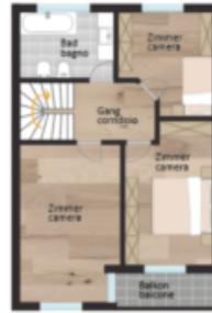
1. Obergeschoss 1° piano