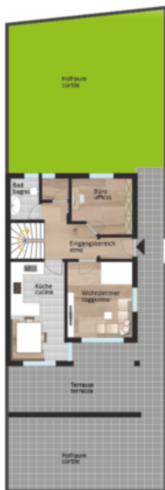
Erdgeschoss piano terra