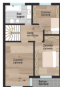
1. Obergeschoss 1° piano