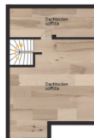
2. Obergeschoss 2° piano