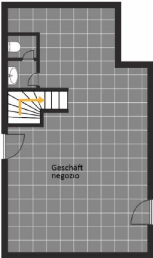
Erdgeschoss piano terra