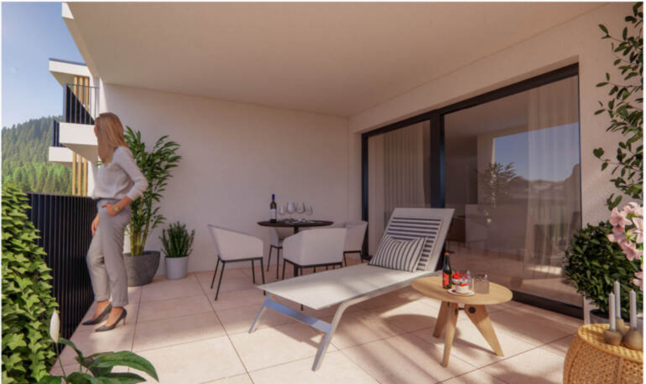
W3/W6 - Lounge