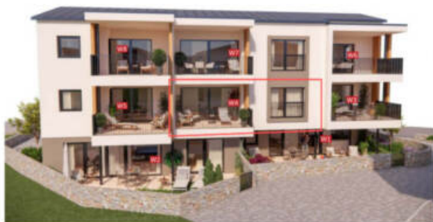
Wohnung 4 - 1.Obergeschoss