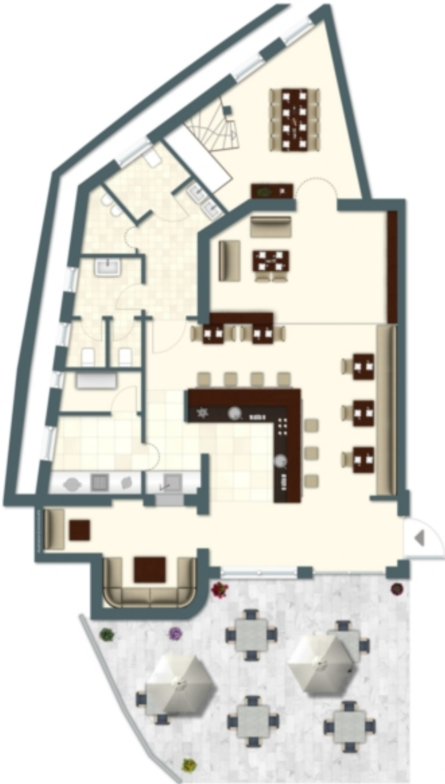
Esposizione, vista sud-est