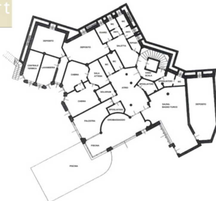
Planimetria n° 1 – Piano Seminterrato