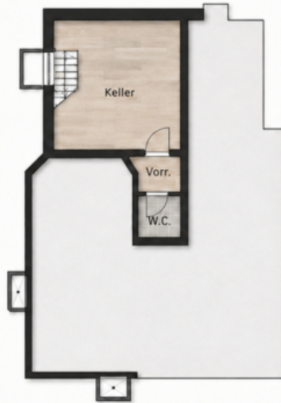
UNTERGESCHOSS H = 2.40