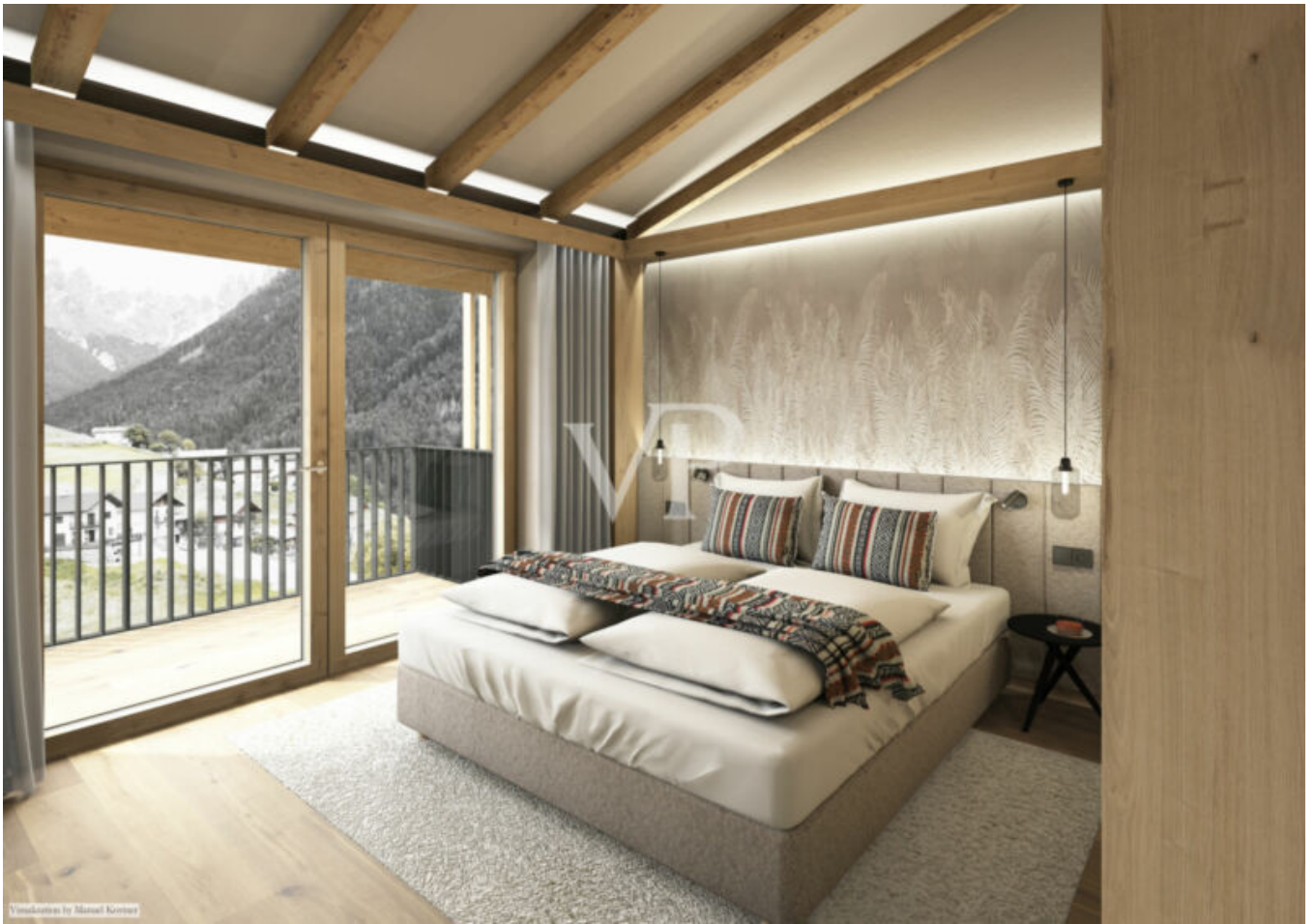
Visualizzato da Manuel Kerzner