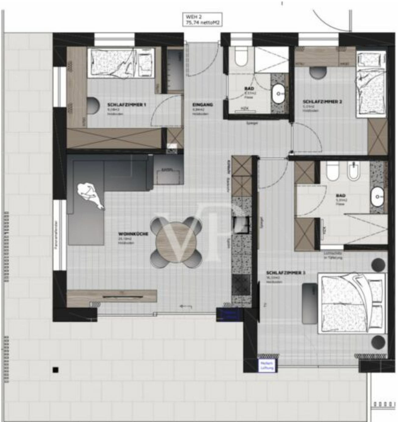
Grundriss Wohnung 02 Dachgeschoss M 1.50