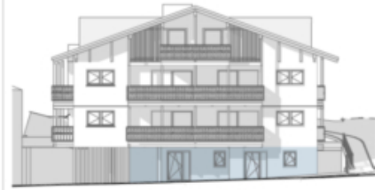
Südansicht Prospetto sud