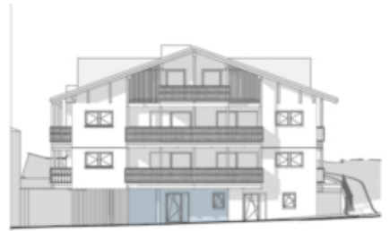
Südansicht Prospetto sud