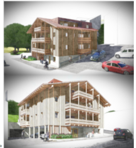
Wohnanlage Residence Dolomiti - Sexten Complesso residenziale Dolomiti - Sesto