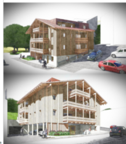
Wohnanlage Residence Dolomiti - Sexten Complesso residenziale Dolomiti - Sesto