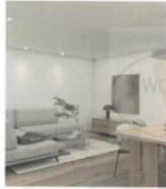
2 Zimmerwohnung mit Garten.