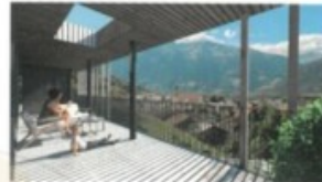
Wohnanlage Leiten Schluderns - Nr. 7