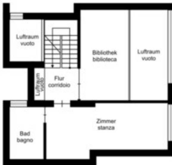
erstes Obergeschoss primo piano

Der Grundriss ist nicht maßstabsgerecht. Diese Unterlagen wurden uns vom Auftraggeber übergeben. Für die Richtigkeit der Angaben können wir daher keine Gewähr übernehmen.