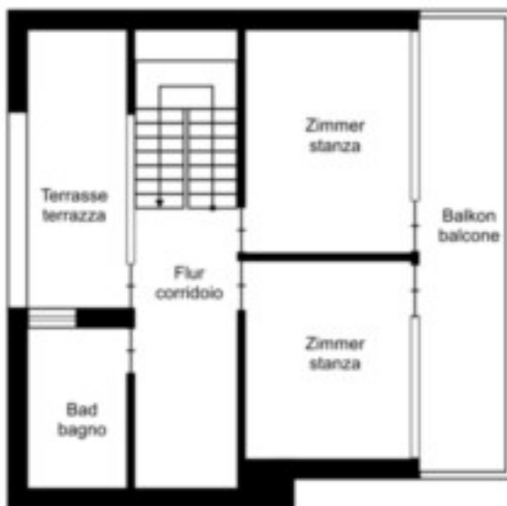
zweites Obergeschoss secondo piano

Der Grundriss ist nicht maßstabsgerecht. Diese Unterlagen wurden uns vom Auftraggeber übergeben. Für die Richtigkeit der Angaben können wir daher keine Gewähr übernehmen.