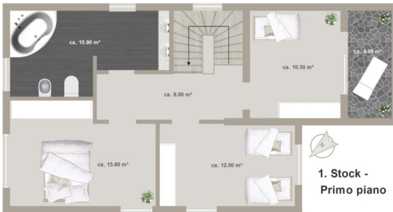
1. Stock - Primo piano